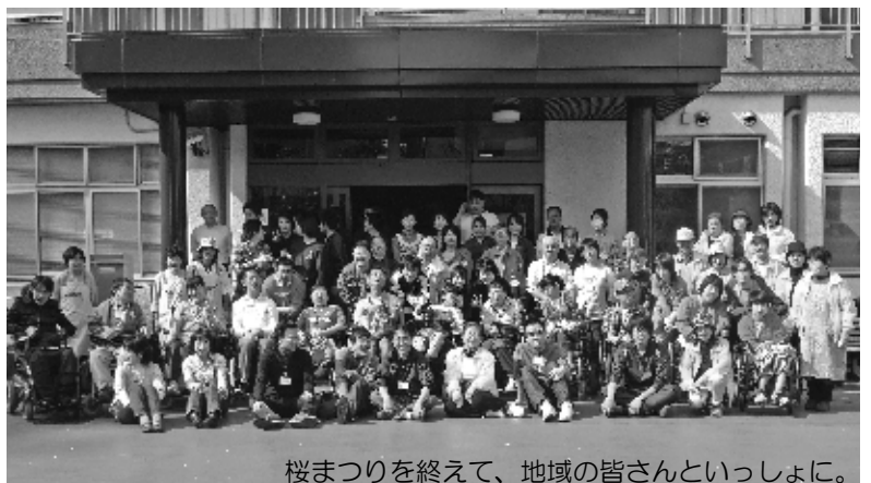
桜まつりを終えて、地域の皆さんといっしょに。