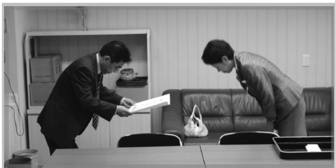
センター長と足立区長様

その後、センターのパソコン班の作業をご覧になり、利用者の方々と会話をして頂いたり、作業・施設について質問などされていらっしゃいました。