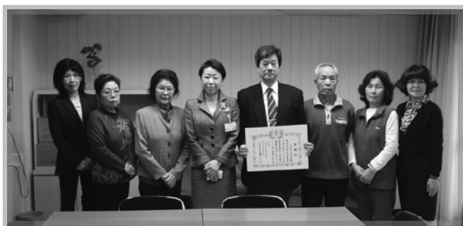
大谷田上自治会の方々と足立区長様

4/12大谷田障害福祉施設の中庭で「第6回ふれあい桜まつり」でチャリティーバザーを催し、今年は新潟中越沖地震義援金として寄付をさせて頂いたところ、日本赤十字社東京支部より、足立区長近藤様を通して「大谷田上自治会」と「足立区大谷田就労支援センター・ホーム」に感謝状を頂きました。