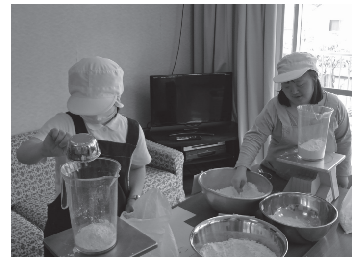
(大谷田就労支援センターと神明福祉作業所の共同実習の様子)

すべてこれらの活動には、ご家族の皆様、関係各所の皆様や地域の方々のご理解・ご協力の上に成り立っています。今後とも、大谷田障がい福祉施設の利用者の方々の、「働く」「暮らす」「健康」を支えていくことにご理解ご協力をいただきますようよろしくお願いいたします。