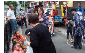
三七会秋祭の様子