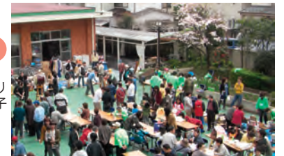
祭 ふれあい桜まつりの様子